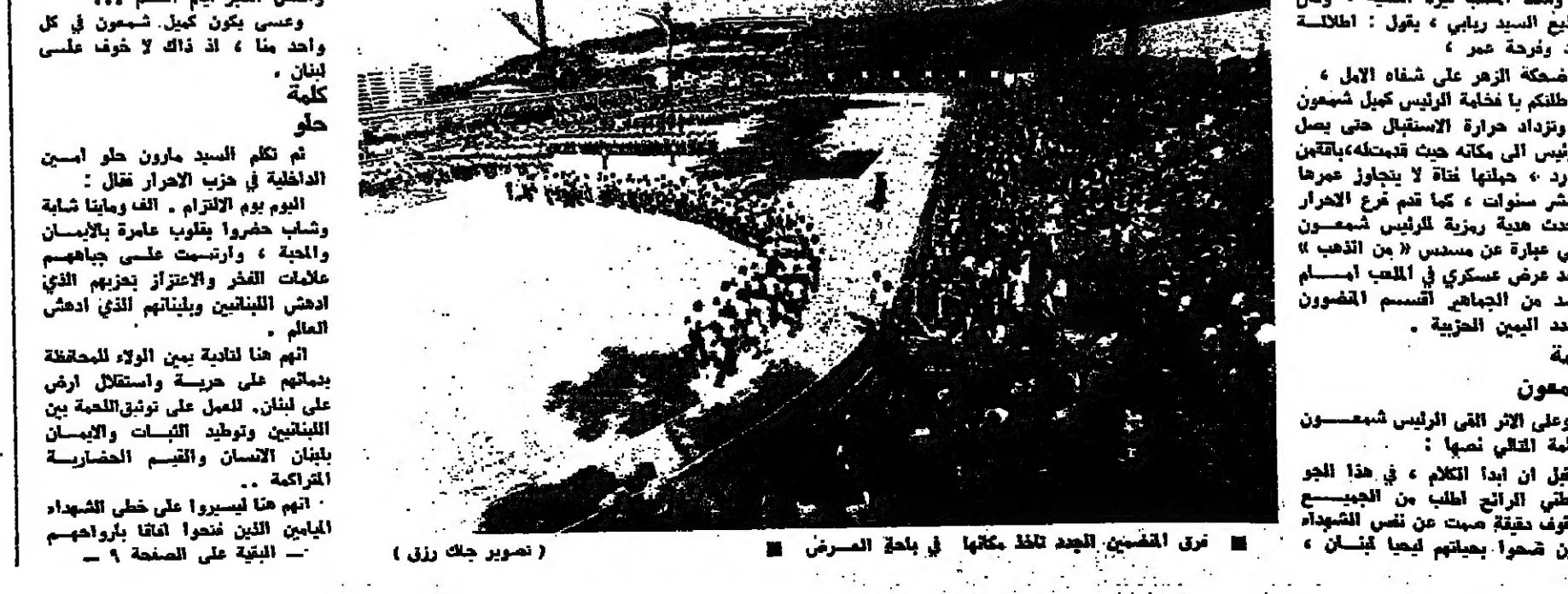
قوى التضمين الجدد تلتكلمها في بلق المرش